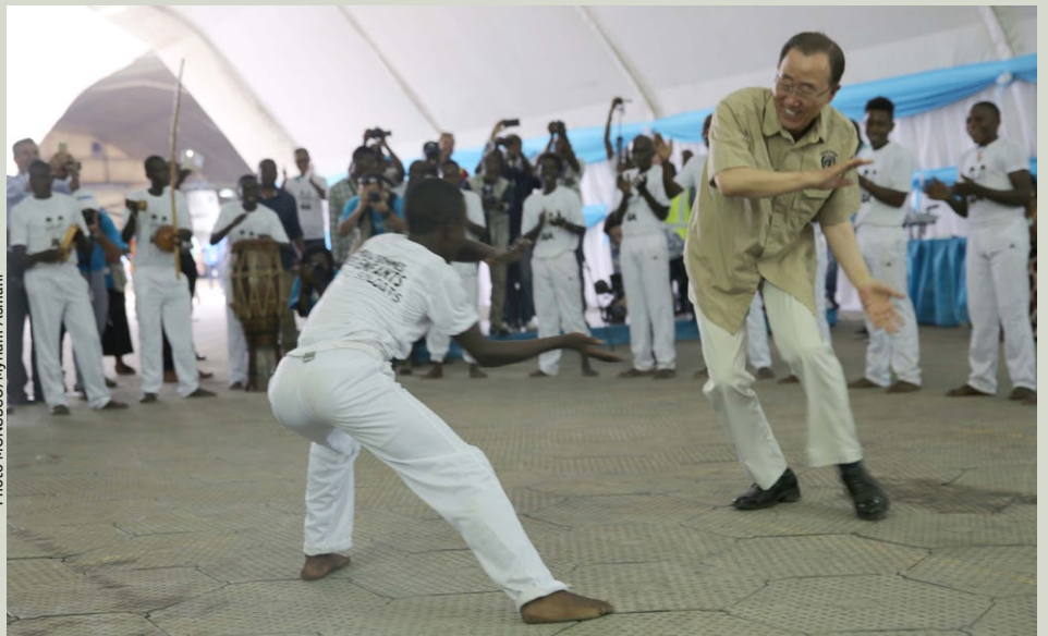
Ban Ki-moon, exécutant quelques phases de Capoeira avec un ex-enfant soldat

Pour le représentant de l'Unicef en RDC, cela fait bientôt deux ans, depuis que les