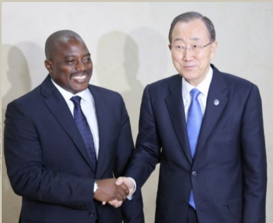
Le Président Joseph Kabila et Ban Ki-moon au Palais de la Nation

Par Theophane Kinda et Aissatou Laba Toure/MONUSCO