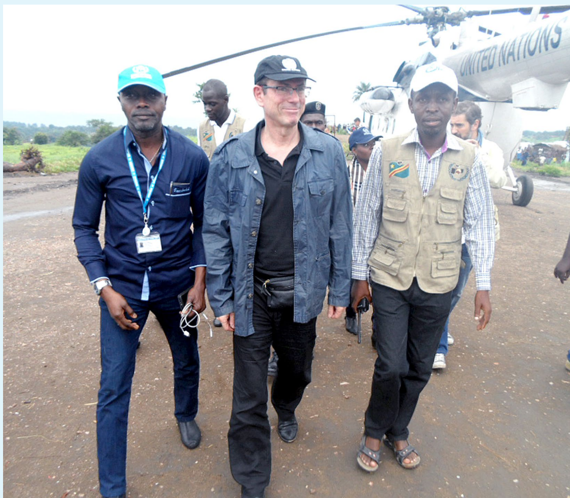
Le SSG H comm de NU aux droits H en visite à Uvira, ici dans le camp des réfugiés burundais de Lusenda

Avant d'effectuer une visite du dispensaire et du poste de Police du camp, le Sous-Secrétaire général des Nations