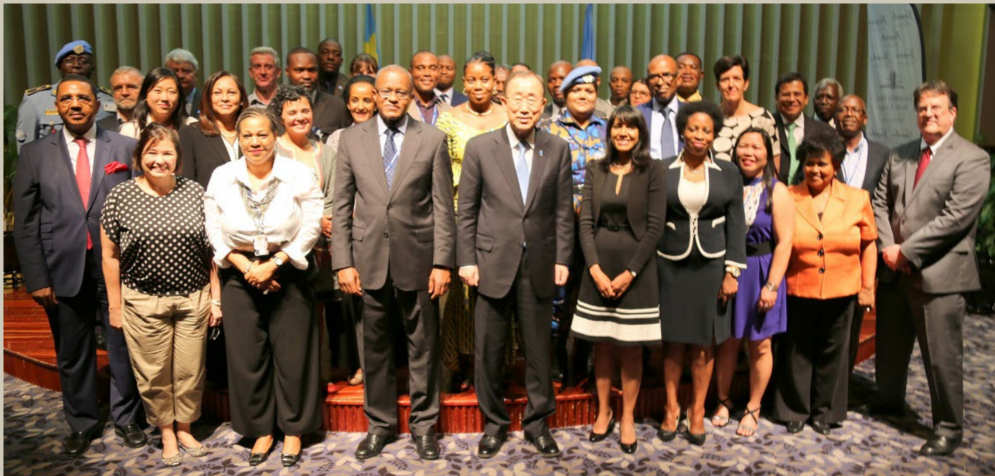
Photo de famille avec une vingtaine de responsable du personnel des Nations Unies en RDC

Unies puissent agir avec professionnalisme. Il y a beaucoup de crises en ce moment de par le monde, beaucoup de situations de frustration mais heureusement il y a de l'espoir et des promesses. Il attend de la part du personnel un engagement fort avec le gouvernement et une disponibilité à soutenir et apporter d'expertise, sur les questions sociales et économiques, le changement climatique et sur les questions politiques ■