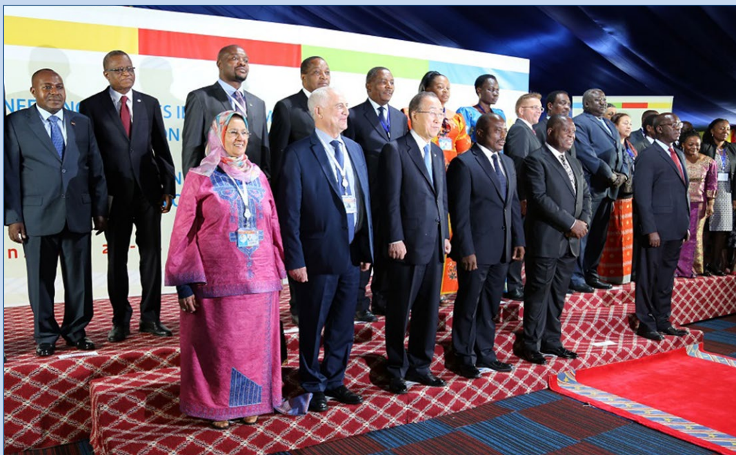
Photo de famille des personnalités, après le lancement de la conférence

La conférence, à travers des panels de discussion entre les gouvernements, les investisseurs du secteur privé, ainsi que d'autres acteurs, a offert un espace de dialogue pour les nombreux partenaires porteurs d'opportunités d'investissement dans la région. Plus de 300 experts du monde des affaires et d'institutions régionales et internationales ont pris part à cette rencontre ■