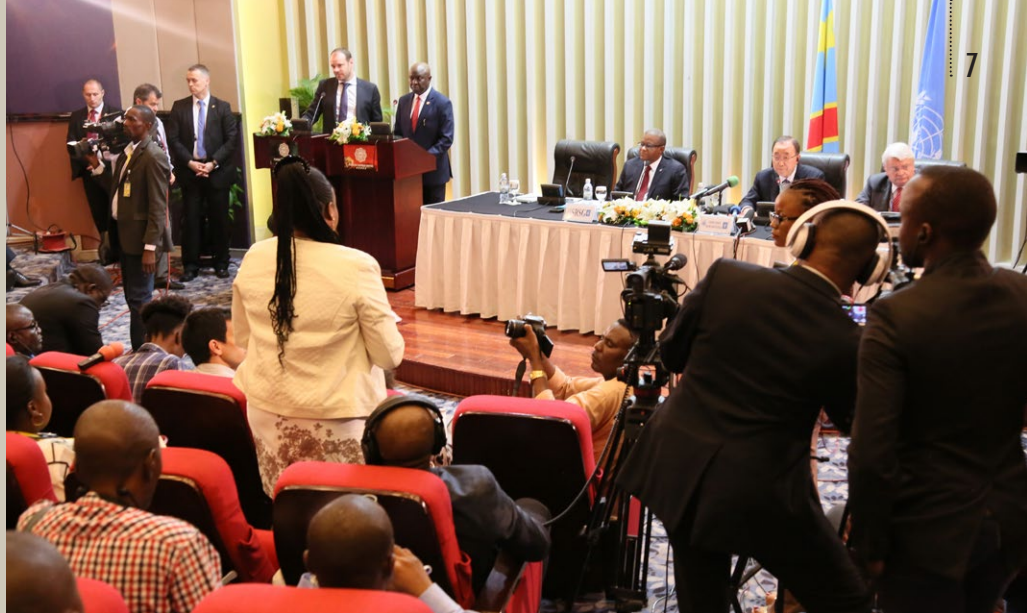
Le Secrétaire général des Nations Unies faisant face à la presse, le 24 février, à l'hôtel Kempinsky, à Kinshasa

Avant toutes ces activités, le Secrétaire général avait rencontré une délégation du