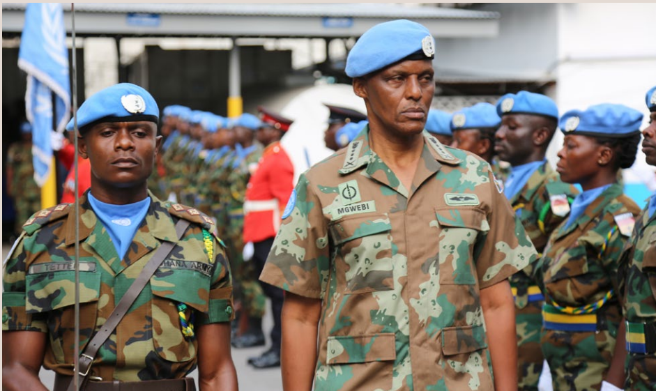
Le Commandant de la Force de la MONUSCO passe à Revue les troupes