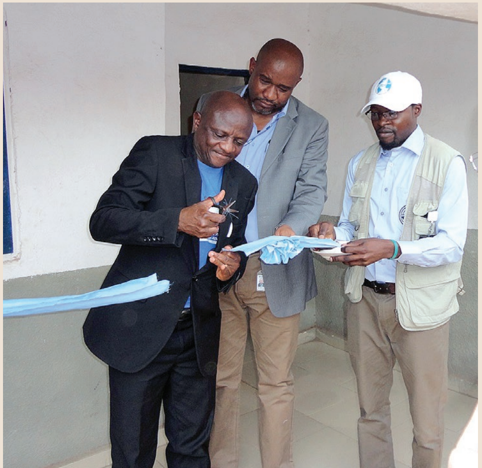
L'Administrateur du Territoire de Nyunzu et le chef de Bureau a.i de la MONUSCO Kalemie coupant le ruban d'inauguration de projets RVS

La mise en œuvre des projets RVC a suscité beaucoup d'enthousiasme dans Nyunzu. Le symbolisme de la cérémonie de lancement a eu lieu dans les locaux de la Radio communautaire RCK équipée en partie sur fonds des projets RVC. L'Administrateur