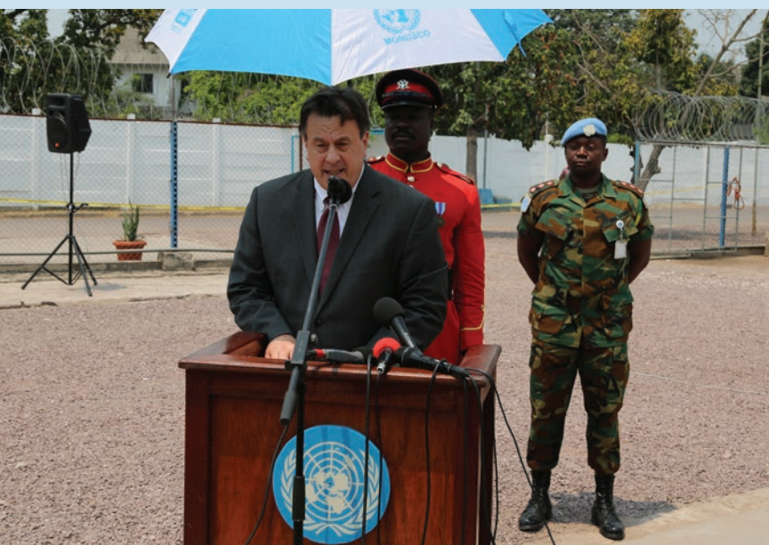
David Gressly prononçant son discours lors de la cérémonie officielle de commémoration de la Journée Internationale de la Paix, à Kinshasa

A Goma , chef-lieu de la province du Nord-Kivu, cette journée a vu des élèves accueillir leurs homologues rwandais venus de la ville frontalière de Gisenyi, soit au total un millier de jeunes qui se sont rassemblés au stade les Volcans de Birere,