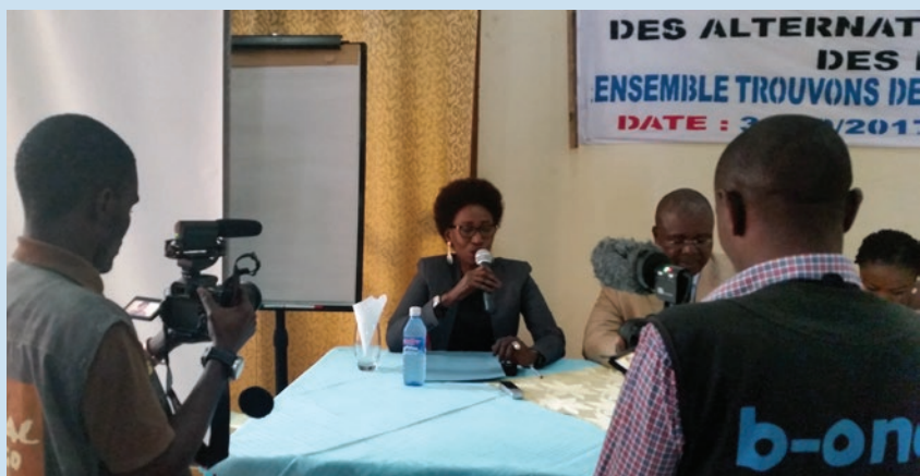
Atelier interactif de sensibilisation des jeunes du Nord-Kivu sur leur implication dans la recherche de la paix

A Uvira , dans le Sud-Kivu, un café de presse a réuni les représentants des médias locaux autour du responsable du bureau de l'Information publique de la MONUSCO. La situation sécuritaire dans les territoires d'Uvira et de Fizi était au cœur des échanges. Les derniers événements de Kamanyola ayant causé la mort d'au moins 36 réfugiés burundais, l'assistance apportée aux victimes par la MONUSCO et les mesures prises pour éviter ce genre de drame à l'avenir, ont été portés à la connaissance des chevaliers de la plume pour une bonne sensibilisation de la population. Outre les informations sécuritaires, la rencontre a surtout permis aux journalistes d'être informés sur le travail abattu par les sections substantives dans la mise en œuvre du mandat de la Mission. Qu'il s'agisse du réseau d'alerte précoce mis en place par la section des Affaires civiles ou de la stratégie opérationnelle de lutte contre l'insécurité à Uvira