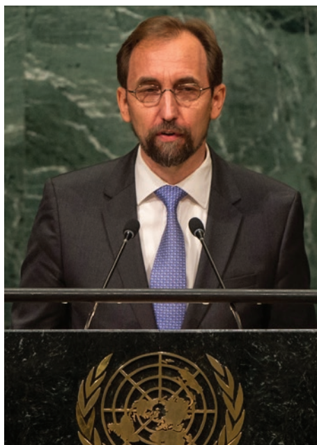
Zeid Ra'ad Al Hussein, Haut-Commissaire de l'ONU aux droits de l'Homme

Suite à ces actions, les forces de défense