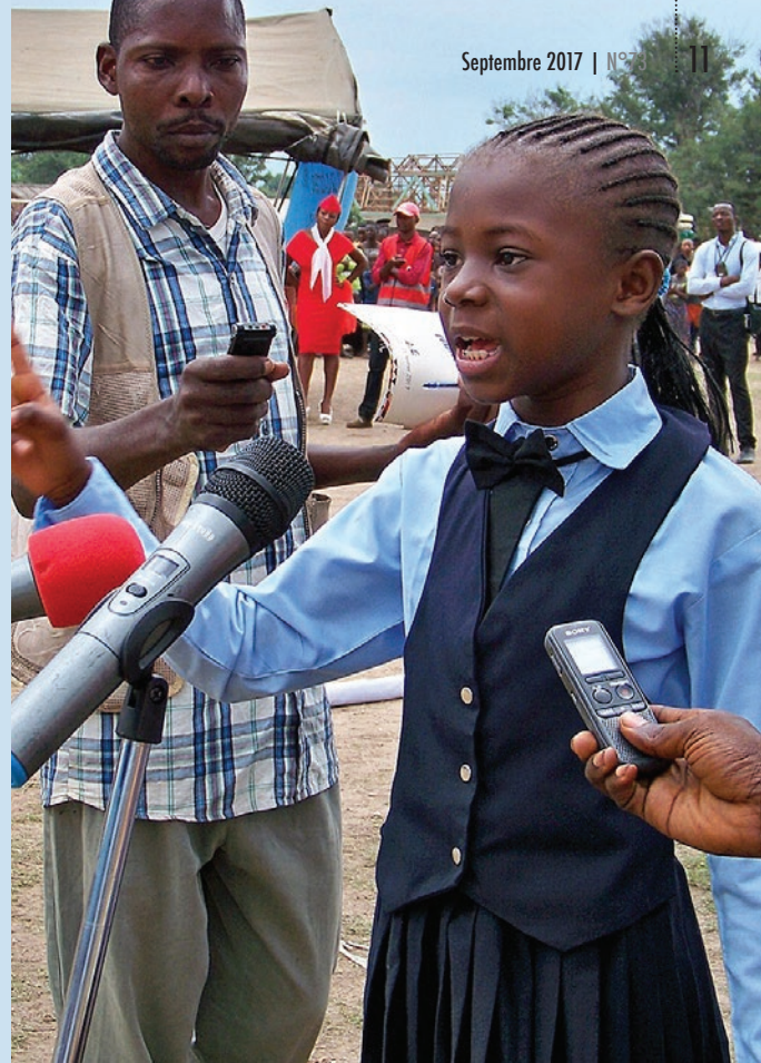
A Kongolo, dans le Tanganyika, une élève décline un poème sur la paix lors de la commémoration de la Journée internationale de la Paix.

A Kinshasa, parmi les activités de sensibilisation et de réflexion organisée dans le cadre de cette journée, on retiendra: la cérémonie officielle; l'atelier pour les représentants des confessions religieuses sur leur apport au processus démocratique en RDC; la réunion de sensibilisation avec les jeunes du district de la Tshangu, en coordination avec la