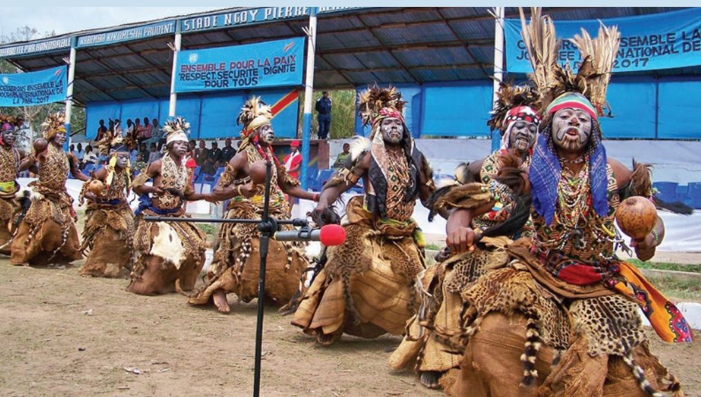
A Kongolo, dans le Tanganyika, un groupe de danseurs traditionnels exécute une danse folklorique à l'occasion de cette journée.

A Kongolo , dans la province du Tanganyika, cette célébration a eu lieu au stade Pierre Ngoy, mettant l'accent sur les expériences de cohabitation pacifique entre les communautés et la protection des personnes déplacées suite au conflit intercommunautaire Twa/Bantou. Seul, le territoire de Kongolo a été épargné par le conflit et a reçu de nombreuses personnes déplacées qui y ont trouvé refuge. Des jeunes venus de Kalemie, à 390 km de là, se sont associés à ceux de Kongolo pour offrir aux populations un concert de musique ponctué de messages de paix et de solidarité. Madame la Ministre provinciale du Genre, Famille, Enfants et Action Humanitaire, qui a procédé au lancement de ce concert, a exhorté les populations à cultiver la paix et s'est dite engagée à soutenir toutes les actions en faveur de la paix. ■