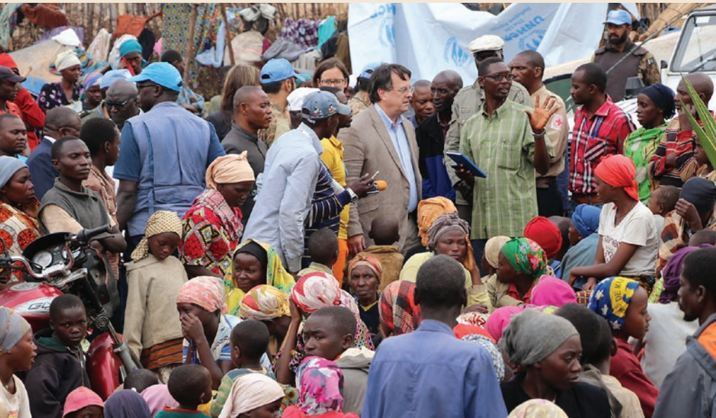
David Gressly échangeant avec des réfugiés burundais lors de sa visite à Kamanyola

La MONUSCO a immédiatement apporté les premiers secours et a distribué de la nourriture et de l'eau. Elle a également assuré la protection des quelque 1 500 réfugiés rassemblés à l'extérieur de sa base à Kamanyola, dans le Territoire de Walungu.