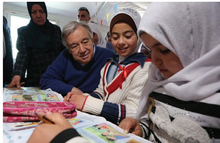
M. Guterres parle avec des écoliers lors d'une visite au camp de réfugiés de Za'atari, en Jordanie, en mars 2017.

J'ai nommé des membres du Groupe de gestion de haut niveau, qui est le niveau supérieur de l'Organisation des Nations Unies. Entre les nominations et le renouvellement des mandats nous avons 19 femmes et 17 hommes, ce qui signifie que je prends au sérieux la parité dans les décisions que je peux prendre. Et nous aurons, à la fin de mon mandat, et c'est un engagement très fort, une parité complète au niveau des Secrétaires généraux adjoints et des Sous-secrétaires généraux à tous les niveaux, dans toute