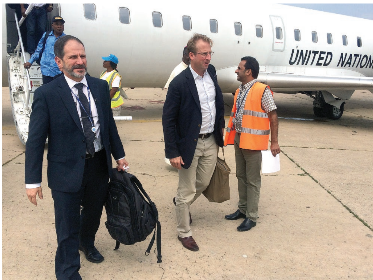
En costume cravate, Robert Petit, enquêteur des Nations Unies sur la piste de l'aéroport de Kananga

Q uand il éclate en 2016, le conflit au Kasai ne ressemble guère qu'à un conflit coutumier parmi tant d'autres dans une région où les querelles de chefferie sont fréquentes.