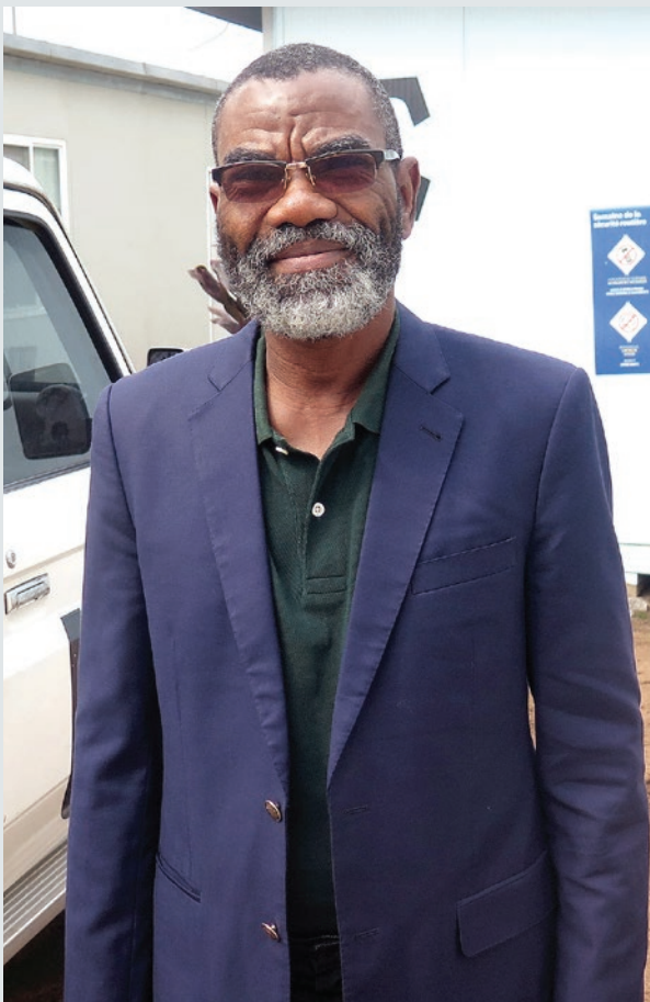
Le Chef de Bureau a.i. de la MONUSCO/Kananga

✎ Propos recueillis par Laurent Sam Oussou/MONUSCO