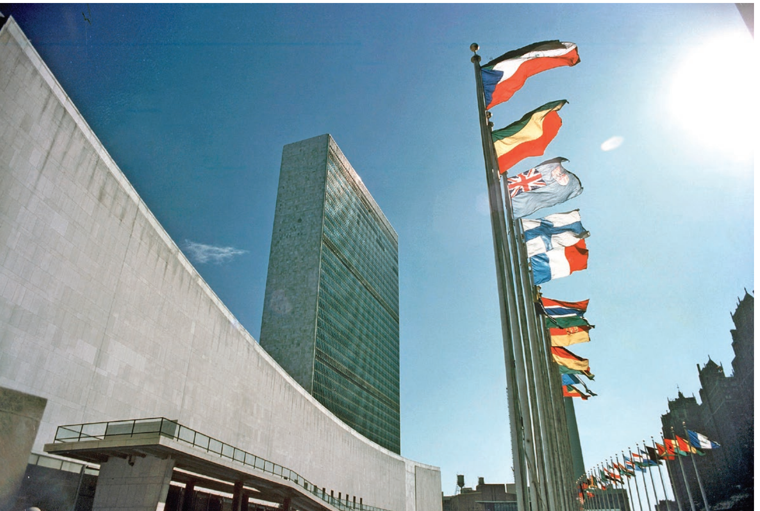
Siège des Nations Unies à New York

Le dépôt des candidatures aux élections législatives et présidentielle est une étape franchie dans le calendrier électoral. Et un fait important est intervenu dans le processus électoral de la RDC : la famille politique de la Majorité s'est choisie un candidat. Aujourd'hui, tous les candidats à l'élection présidentielle du 23 décembre sont connus. Le Conseil de Sécurité et la Communauté internationale souhaitent voir le processus électoral se dérouler dans la transparence et dans un climat apaisé.