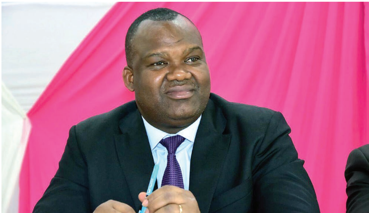
Corneille Nanga, président de la CENI

efficace, rapide et sincère de cet Accord est essentiel pour la tenue d'élections pacifiques et crédibles le 23 décembre 2018, ont réitéré les membres du Conseil.