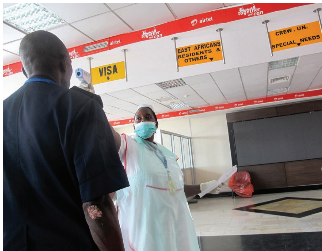
Prise de température d’un passager dans un aéroport d’un pays de l’Est de la RDC

Tous les efforts sont donc mis en commun pour “casser la chaîne de transmission du virus” car prévient le ministre congolais, la fin de l’épidémie à virus Ebola passe par une implication totale de toutes les composantes de la société! ■