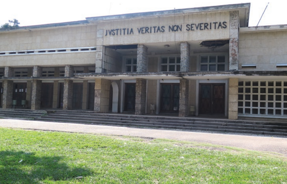
Le bâtiment abritant le Parquet général et la Cour d'Appel à Kananga

✎ Par les Sections pénitentiaire et Appui à la Justice/MONUSCO