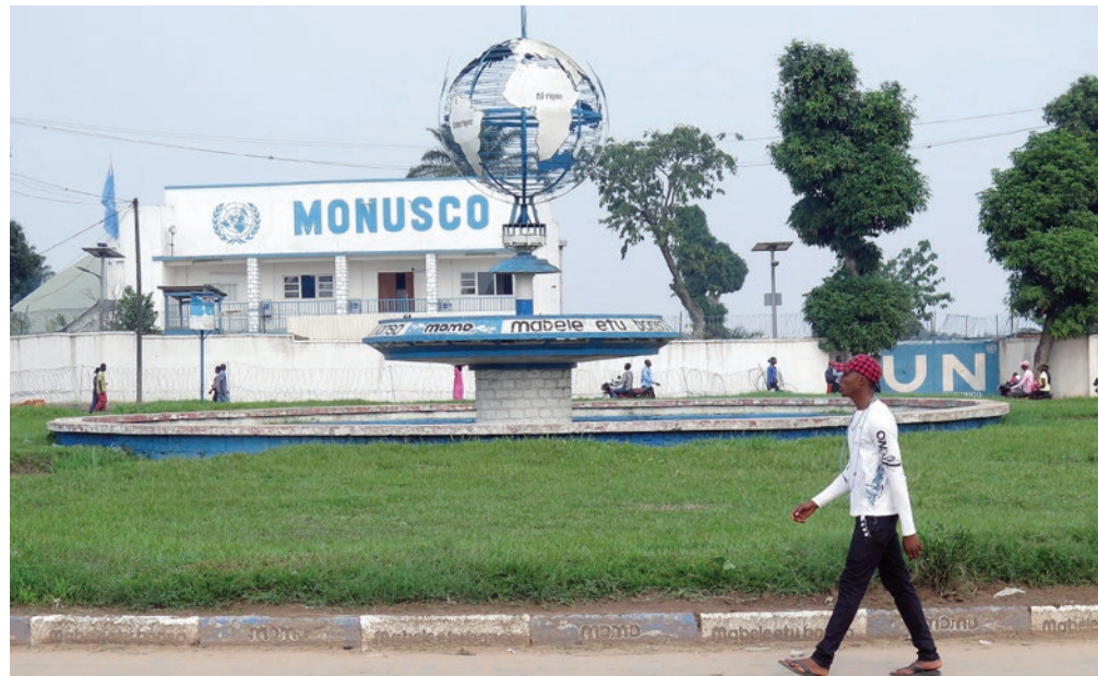
Le Quartier général de la MONUSCO à Kananga

Au total, 11 déploiements majeurs de la Base opérationnelle de la compagnie (COB) et de Déploiement d'urgence de troupes (SCD) ont été entrepris jusqu'à présent. Plus de 30 missions de longues portées ont été déployées à ce jour entre juillet 2017 et juillet 2018. La Force de la MONUSCO a également mené cinq importantes missions de sauvetage en soutien du personnel des Nations Unies et des civils, soit en danger ou après un crash d'avion.