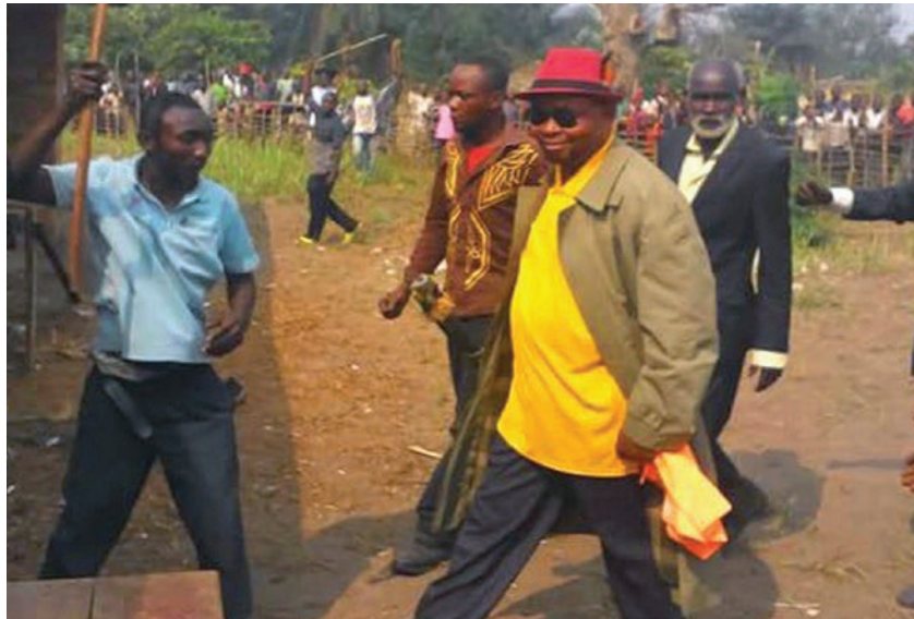
En lunettes et chapeau, le chef Kamwina Nsapu (Nsapu Pandi)

Depuis juin 2016, la milice, en violation des législations sur le maintien de l'ordre public et de l'autorité de l'Etat, a érigé des barrières de la localité de Mbondo jusqu'à