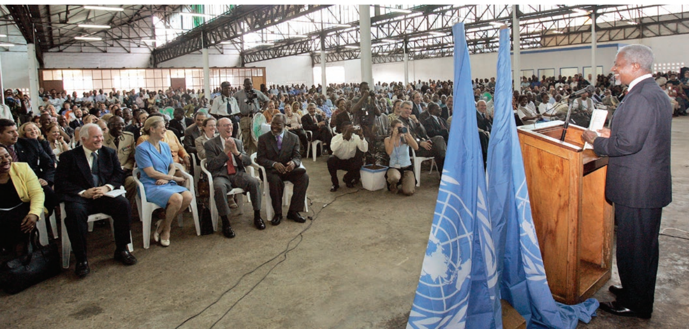
Kofi Annan s'adressant au personnel de la MONUC au site INCAL à Kinshasa

Le Ghana, son pays s'apprête à lui rendre un hommage national le 13 septembre 2018, en présence des grands de ce monde. Accordons le dernier mot au président ghanéen, Nana Akufo-Addo : "Kofi Annan a considérablement contribué à la renommée de notre pays, par sa position, par sa conduite, par son comportement dans le monde. Il est une source de fierté pour tous les Africains" . ■