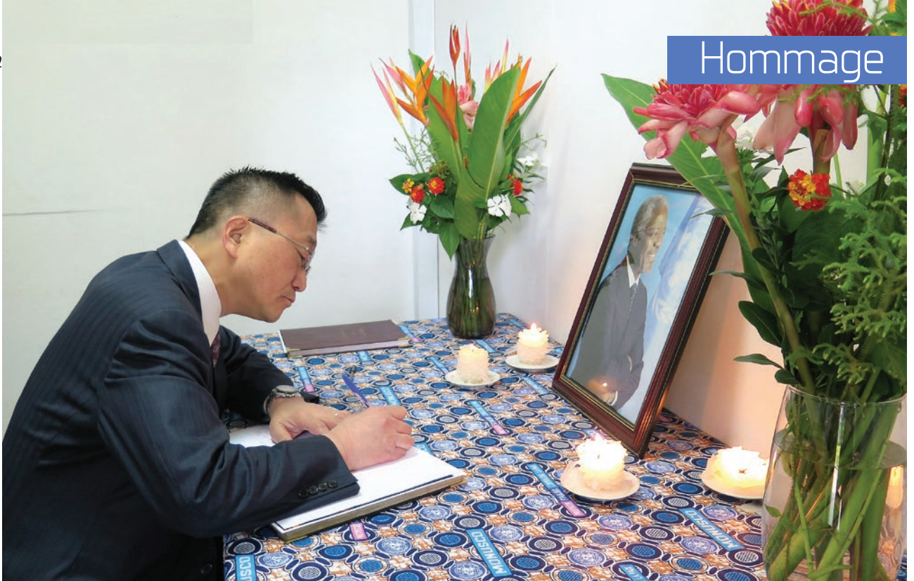
L'Ambassadeur du Japon, inscrit son mot dans le livre de condoléances ouvert à la MONUSCO

complexes et critiques : "son souvenir restera à jamais dans le cœur des Russes" . Barack Obama quant à lui, a mis l'accent sur son intégrité, sa détermination, son optimisme et son sens de notre humanité partagée". Angela Merkel dit sa tristesse : "il va beaucoup nous manquer à une époque où la recherche en commun de solutions aux problèmes mondiaux est plus urgente que jamais" . Le Président Joseph Kabila, dans un communiqué publié le jour de l'annonce du décès, a rendu hommage "à ce diplomate de haut niveau qui a fait honneur à l'Afrique et dont la performance dans l'accomplissement de ses hautes charges a été saluée par le monde entier" . Il a salué "la mémoire de Kofi Annan pour sa contribution remarquable à la consolidation de la paix en RDC" . Il faut se rappeler qu'en septembre 2001 et mars 2006, Kofi Annan avait effectué deux visites en République démocratique du Congo. La première pour soutenir le processus électoral et la seconde, quelques mois après l'adoption de la nouvelle Constitution et avant la tenue des premières élections multipartites. Le