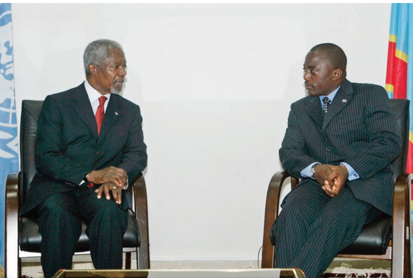
Kofi Annan avec Joseph Kabila, lors de sa visite en RDC en 2006

Retraçons son parcours en commençant par sa naissance en avril 1938 à Kumasi, au Ghana. Il a étudié à l'Université scientifique et technologique, à Kumasi, et a achevé sa licence d'économie au Macalester Collège, à St. Paul (Minnesota) aux États-Unis, en 1961. En 1961 et 1962, il a fait des études de troisième cycle en économie à l'Institut universitaire des hautes études internationales, à Genève. En 1971 et 1972, au Massachusetts Institute of Technology, M. Annan a obtenu son diplôme de Maîtrise en Sciences de Gestion. Après des études d'Economie à Genève, il entre à l'Organisation mondiale de la Santé (OMS). De 1993 à 1996, il est le Secrétaire général-adjoint aux Opérations