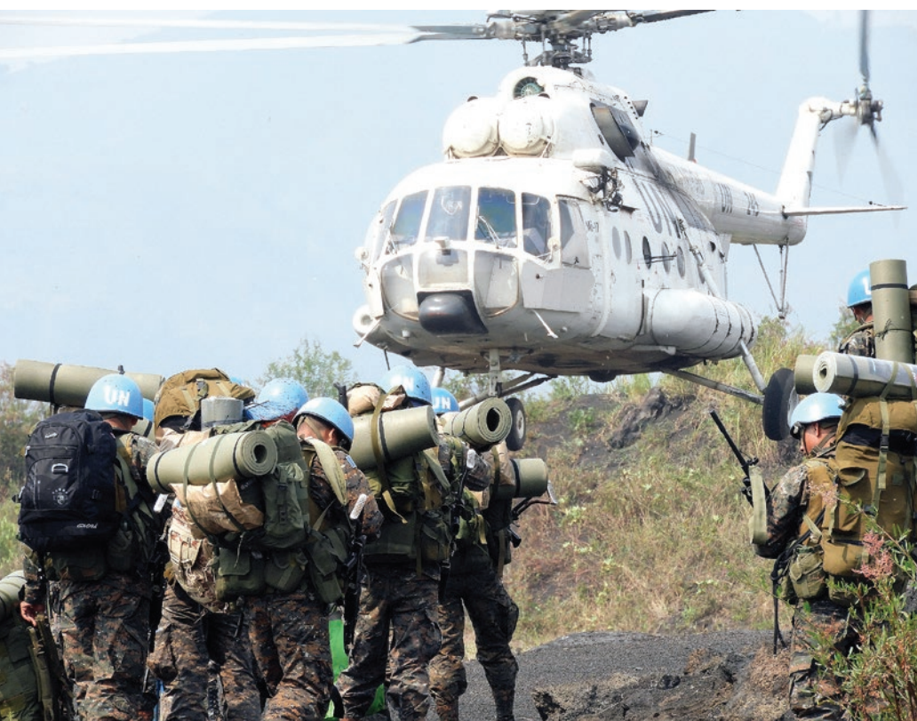
Les Casques bleus en opérations

A près la mort du dirigeant de Kamuina Nsapu, "Jean Mpandi", en août 2016, des miliciens de Kamuina Nsapu ont lancé une attaque afin de le venger à l'aéroport de Kananga le 23 septembre 2016 et mis le feu aux installations de la force aérienne des FARDC ainsi que d'autres équipements. Depuis décembre 2016, les FARDC ont repris leurs opérations offensives et se sont déployées dans la région du Kasai qui est devenue une zone opérationnelle des FARDC en vue de mettre un terme à l'insurrection Kamuina Nsapu et à la vague de violence et à l'insécurité qu'elle a favorisée.