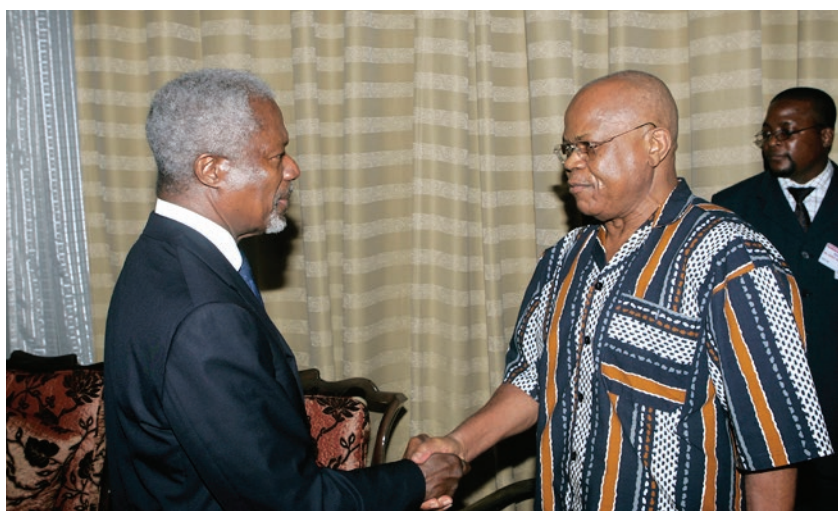
Kofi Annan et Etienne Tshisekedi en 2006

L'on retiendra, dans sa longue et déterminante carrière aux Nations Unies : la guerre sans merci qu'il a menée contre le Sida (création du Fonds mondial pour la lutte contre le Sida) et les grandes pandémies qui ont ravagé l'Afrique et le monde pendant ces dernières décennies ; sa bataille pour la réalisation de son initiative phare : le programme OMD (Objectifs du Millénaire pour le développement) lancé en