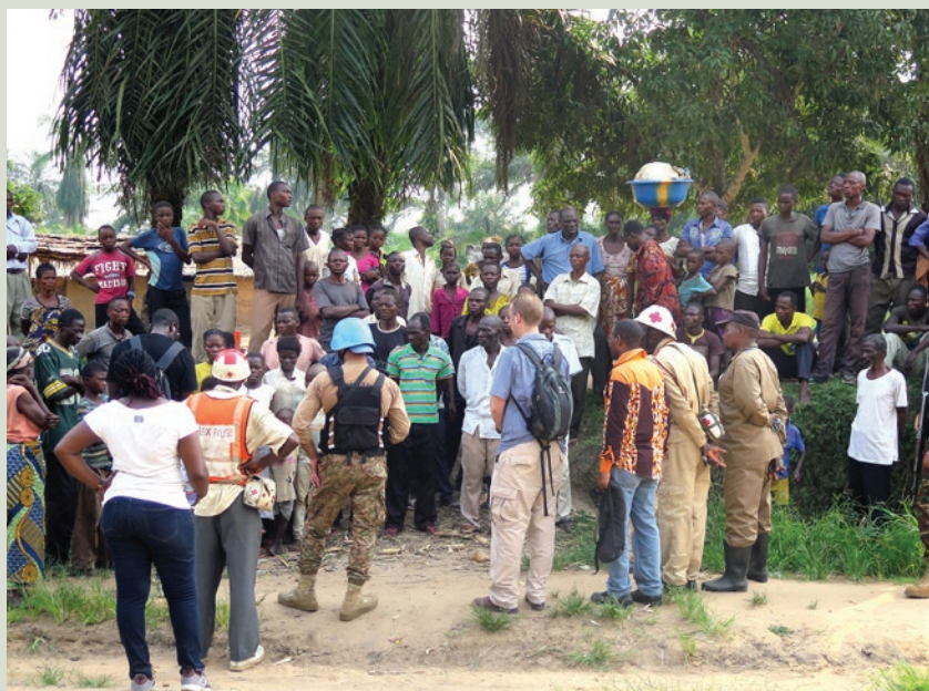
Une délégation de la MONUSCO en missoin à Kakenge

En rapport avec les projets de développement, le bureau a réceptionné de la part des organisations nationales et internationales 18 projets pour la région du Kasai dont 2 sont en phase d'exécution.