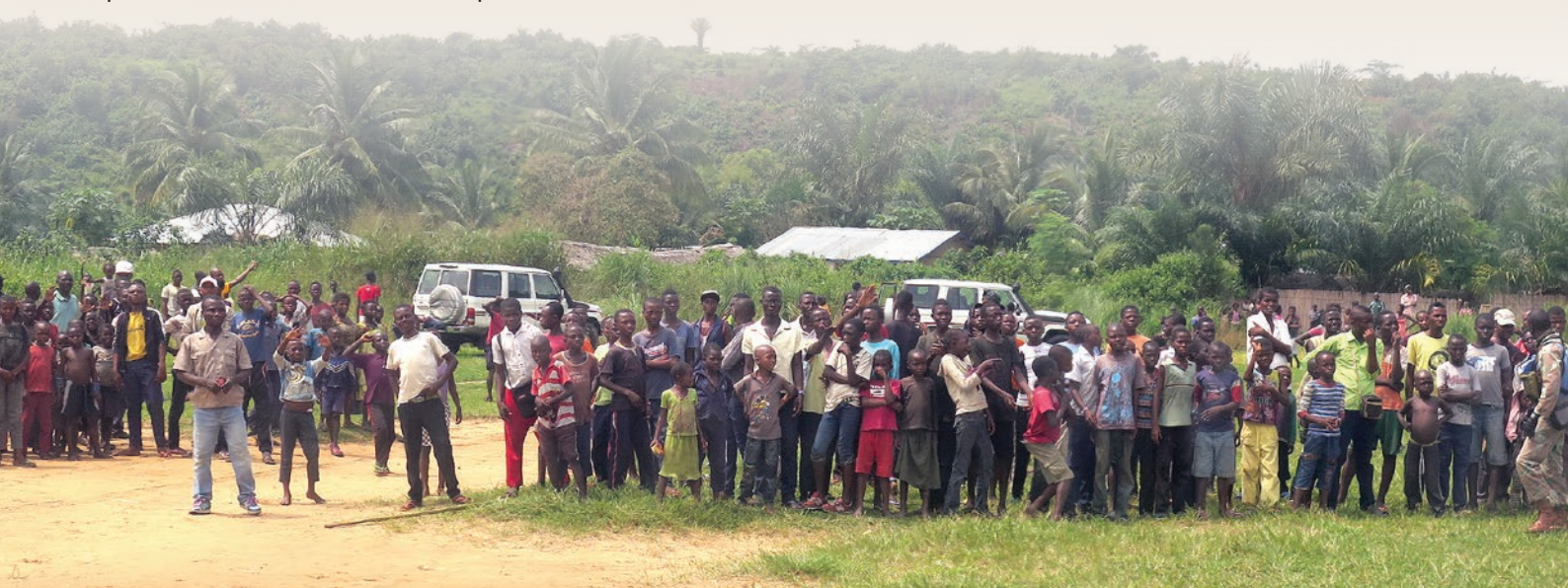
Une foule, composée essentiellement de jeunes venue à la rencontre d'une mission de la MONUSCO à Lusambo

Le dialogue pour la séparation des enfants des factions de la milice Kamuina Nsapu dans les zones de recrutement actuel reste un défi d'autant plus que cette milice n'a ni un seul leader, ni interlocuteur ayant une volonté vraisemblable de séparation des enfants. ■