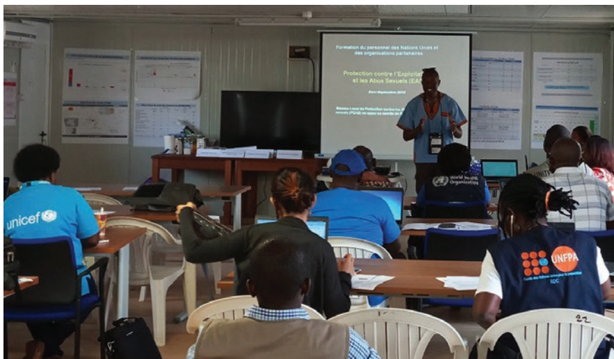
Une vue des participants à la séance de sensibilisation organisée à Mangina

Pour intensifier davantage la prévention et le signalement des cas, il a été décidé qu'une formation des points focaux sera organisée. Chaque agence et partenaire de l'ONU désignera un point focal qui sera formé comme formateur et sera chargé de la formation et de la sensibilisation au niveau de son organisation. ■