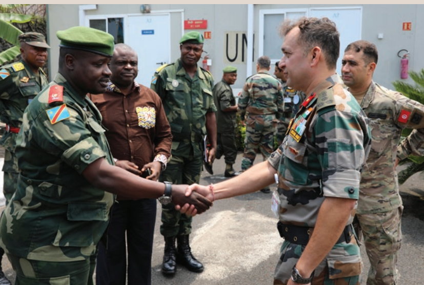
Poignée de main entre le commandant secteur, SOKOLA 2 et le commandant du secteur centre de la MONUSCO