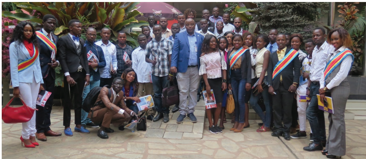
Les jeunes ayant participé à l'initiation à la culture de la paix et la non-violence posent pour une photo de famille

Le Bureau MONUSCO, en Ituri, en collaboration avec les membres du Parlement des Jeunes, a célébré la Journée internationale de la Paix, sur le thème local : “Jeunes pour la Paix et la culture de la non-violence dans la province de l'Ituri” . Les soixante participants, filles et garçons de la ville de Bunia ont, en préambule, assisté à la projection du film intitulé “Invictus” dans lequel le réalisateur américain Clint Eastwood raconte comment le Président Nelson Mandela a pu créer un sentiment d'Union Nationale autour de l'équipe de rugby des Springboks, restée durant toute la période de l'apartheid (1948-1991), le symbole de la suprématie des Blancs d'Afrique du Sud sur les Noirs. S'inspirant du contenu très profond de ce film qui dépeint la lutte nécessaire pour le pardon, un président et un capitaine d'équipe, François Pienaar, chacun issu de communautés se haïssant, deux leaders s'unissaient pour une cause : la Nation.