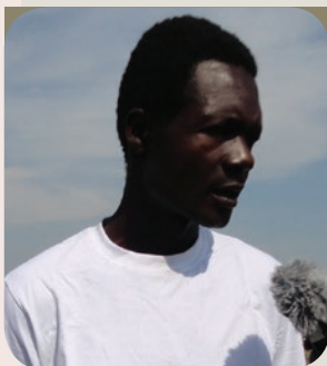
Le chef de localité MIKETO, village situé à 35 km de Kalemie. Il est membre de l'ethnie bantoue

"Le droit à la paix signifie le droit à la protection, le droit à envoyer nos enfants à l'école, le droit à être assistés. Vous voyez, nous avons tout perdu à cause du conflit avec nos frères Twa. Maintenant nous vivons la paix, mais elle n'est pas totale. Il y a encore beaucoup de choses à faire pour qu'elle soit totale ici chez nous. Au gouvernement congolais ainsi qu'aux Nations Unies, nous disons : multipliez des initiatives comme celle de ce jour, qui nous permet de célébrer la journée de la paix comme partout ailleurs dans le monde".