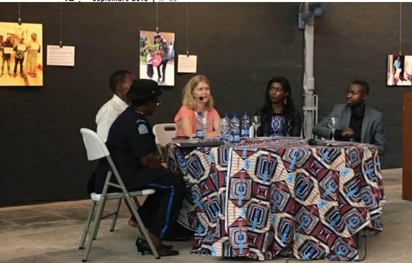
Le panel de discussion sur la promotion des masculinités positives et l'égalité des genres se déroule sous la modération de l'Ambassadrice de la Suède

L'exposition de la MONUSCO sur les "masculinités positives" se concentre essentiellement sur ces hommes Champions en tant qu'exemples, tandis que celle de l'Ambassade de Suède consiste à montrer des photos des pères suédois qui ont choisi de prendre des congés de six mois pour s'occuper des enfants à la maison.