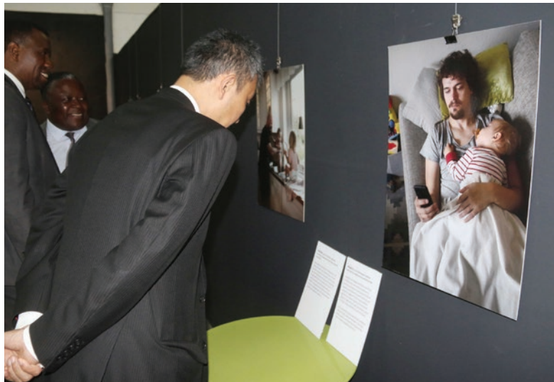
Des participants visitent l'exposition-photos sur les champions de la masculinité positive

L'exposition conjointe "Les Pères suédois et les Champions de la masculinité positive en RD Congo" qui s'est déroulée du 20 au 30 septembre 2018 se situe dans ce cadre.