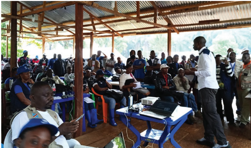
Le personnel de l'ONU et des agences humanitaires sont sensibilisés en particulier pour prévenir tout acte d'exploitation et d'abus sexuels

Au cours de ces sensibilisations, il a été rappelé que les Nations Unies et tous ceux qui travaillent en partenariat avec elles sont liées par les mêmes règles en matière de protection contre l'exploitation et les abus sexuels. Il a aussi été rappelé que l'intégrité, le professionnalisme et le respect de la diversité doivent être à la base de notre comportement et que, de ce fait, il nous est interdit toute activité sexuelle en échange d'argent, de matériel ou de vivres. De même qu'il est interdit d'avoir une quelconque activité à caractère sexuelle avec un enfant (personne de moins de 18 ans), d'utiliser la force ou la supériorité