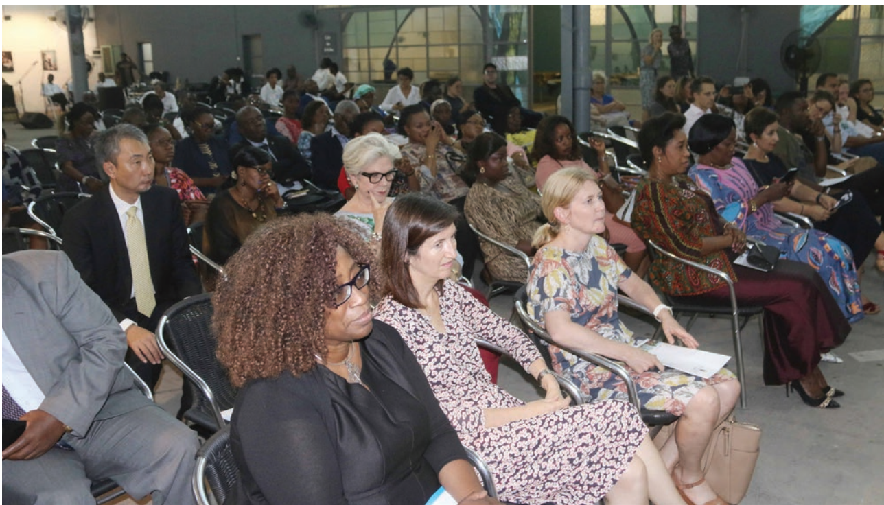
Un public attentif lors des interventions sur la question de la masculinité positive

E n effet, consciente de l'importance du rôle que les hommes et garçons peuvent et doivent jouer dans la promotion de l'égalité des sexes, la Section a sélectionné, à travers un appel à participation, 14 hommes comme Champions de masculinités positives à travers la RDC. Ces champions ont déjà mené et continuent de mener plusieurs activités éducatives dans leurs communautés respectives à Kinshasa et Goma à l'endroit d'autres hommes et jeunes pour promouvoir la cohabitation pacifique, une citoyenneté responsable, à travers un partage de responsabilité, un soutien à l'égalité et à la paix.