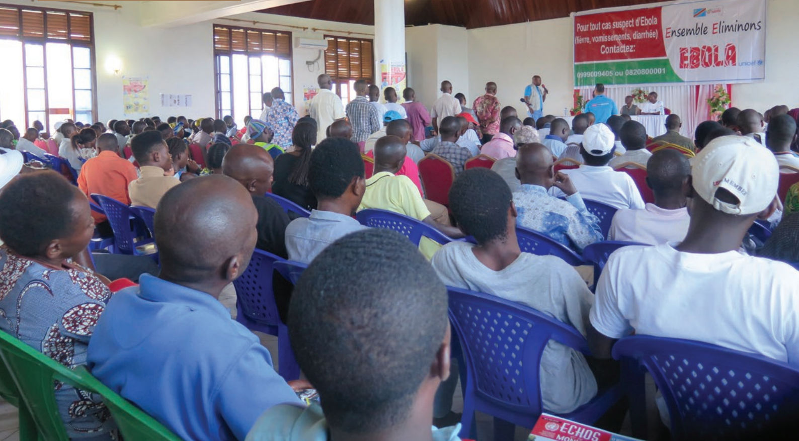
L'assistance, composée de 300 personnes, écoute attentivement les explications fournies par les experts invités

et des fausses informations. A cela s'ajoute le fait que c'est la première fois que l'épidémie d'Ebola est déclarée dans cette région, frontalière avec l'Ouganda et à forte densité de population.