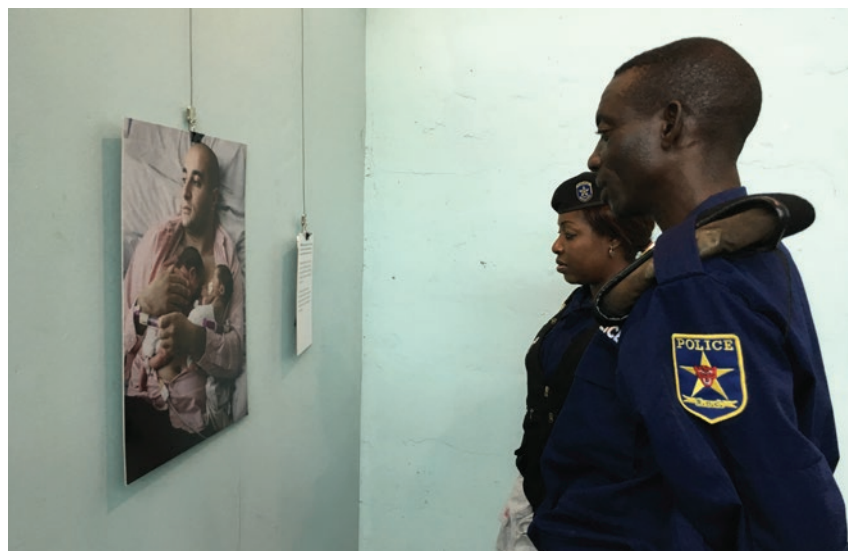
Deux membres de la PNC contemplant la photo d'un père suédois ayant choisi de prendre un long congé pour s'occuper de ses enfants

En définitive, en prenant cette initiative, les organisateurs attendent que ces discussions basées sur les expériences vécues des Champions Congolais et des Pères Suédois soient une source d'inspiration pour d'autres hommes qui, à leur tour feront le choix d'adopter une citoyenneté responsable en partageant les responsabilités, en s'engageant pour la paix et en soutenant l'égalité avec une transformation de la masculinité qui écrase, en une masculinité au service de leurs ménages, communautés et Nation. ■