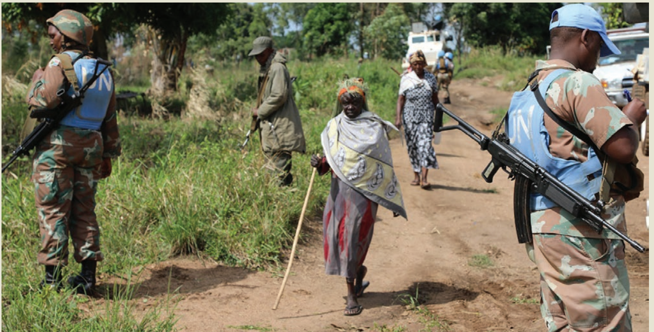
Populations de Beni vaquant à leurs occupations sous la protection des FARDC et Force onusienne

“L e commandement du secteur opérationnel vous affirme officiellement que le territoire de Beni fait face au terrorisme des ADF dont la structure de commandement est tenue par les ougandais. S'agissant du bilan pour l'instant, les chiffres qui sont à ma disposition indiquent provisoirement 14 civils