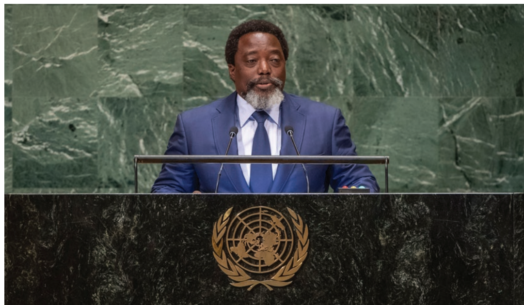
Le Président Kabila, prononçant son discours le 25 septembre à la tribune de l'ONU

Il faut noter que le Président de la Commission de l'Union Africaine M. Moussa Faki Mahamat, le Président de la Commission européenne M. Jean-Claude Juncker et le Secrétaire général des Nations Unies M. Antonio Guterres se sont rencontrés le 23 septembre au Siège de l'ONU, à New York en marge de l'Assemblée générale, pour discuter de l'actuelle coopération entre les trois organisations et de la manière de mieux coordonner leurs efforts afin de faire face aux défis mondiaux contemporains. Concernant notamment la République Démocratique du Congo (RDC), les trois organisations ont souligné l'importance de la stabilité de ce pays pour l'ensemble de la région des Grands Lacs, et ont réaffirmé leur engagement en faveur du soutien à des élections transparentes, inclusives, pacifiques et crédibles pour la fin 2018. ■