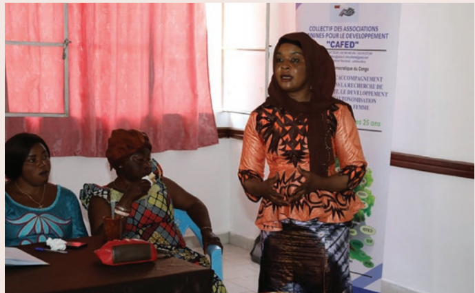
La présidente de du CAFED présente les acquis et réalisations de son organisation lors du Forum sous-régional sur les avancées et les défis dans la lutte pour les droits des femmes.

Ce n'est pas tout. Le collectif des femmes a participé dans la mise en œuvre de la déclaration de Kampala, en 2010. Elles ont apporté leurs contributions dans la conception de