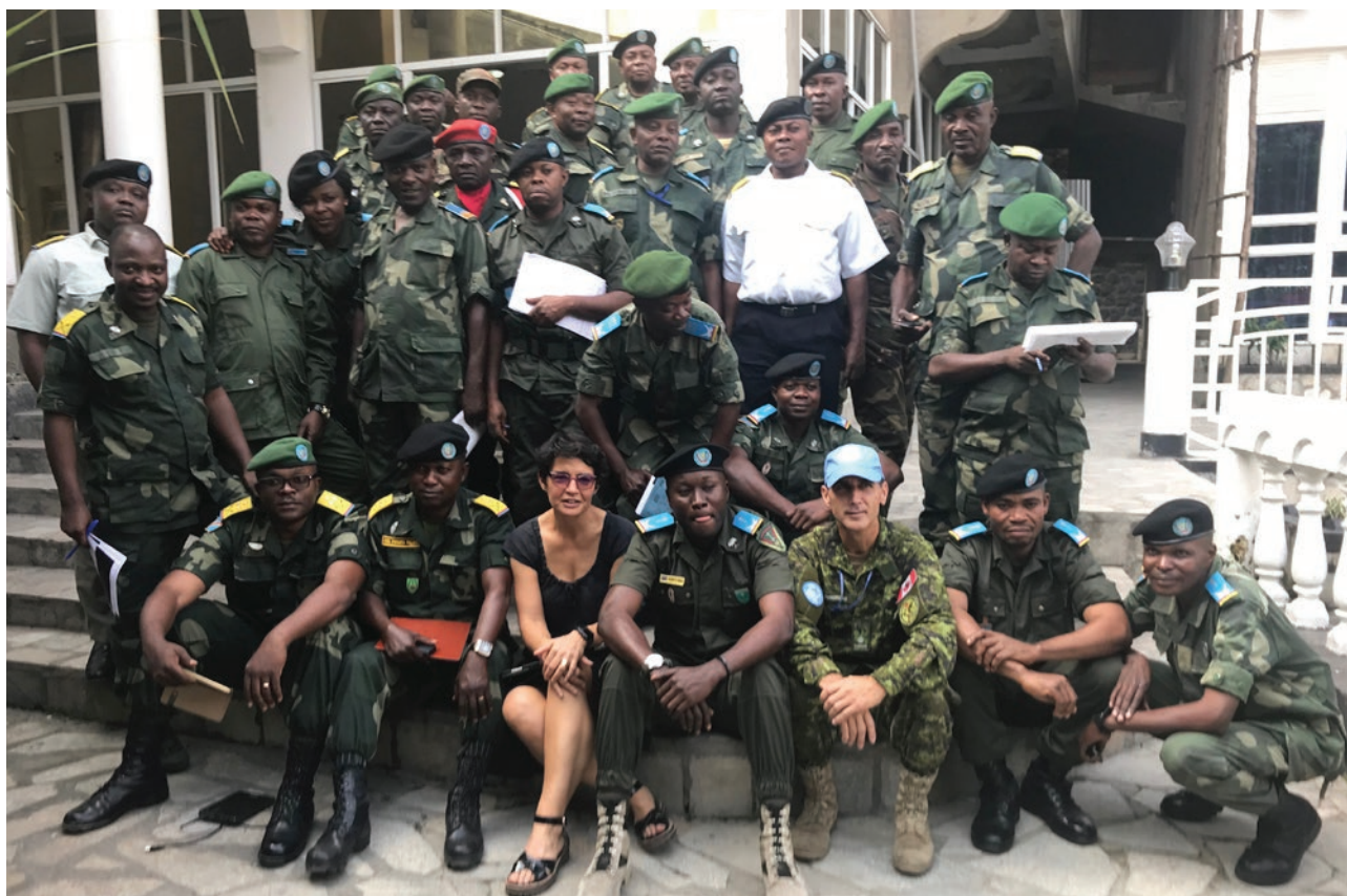
Photo de famille des participants à l'atelier de Goma

D ans le cadre de la réforme de l'Armée, l'Etat-major Général des FARDC se dote de conseillers juridiques que l'on retrouve dans l'ensemble de la structure FARDC dans la chaîne de mise en condition ainsi que dans les divers quartiers généraux au niveau national.