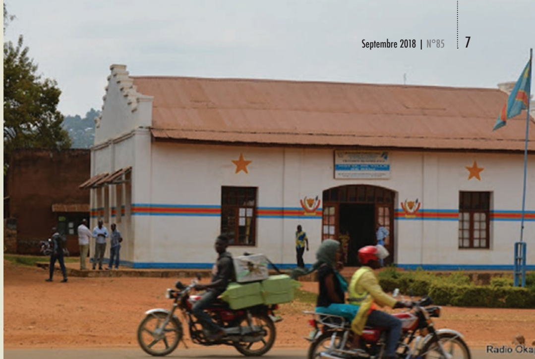
Vue de la mairie de Beni

l'implication des populations, afin que les forces puissent intervenir en amont. "Je souhaite saisir cette occasion pour dire que notre action sera d'autant plus efficace que nous aurons l'information nécessaire en temps voulu. Je parle aussi de l'information dont certainement beaucoup de civils disposent parce qu'ils voient des gens suspects, en uniforme militaire mais dont ils ne sont pas certains qu'ils les connaissent dans cette zone, nous avons besoin qu'ils nous donnent ces informations, sans hésiter sur ce qui leur paraît suspect".