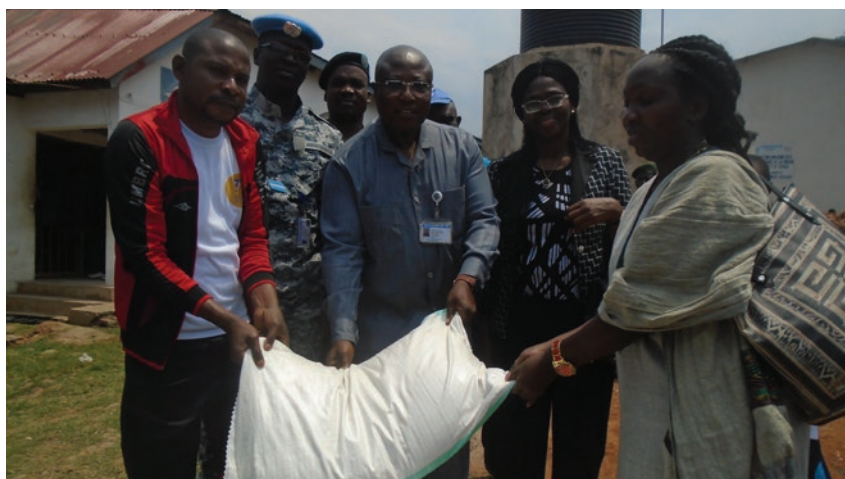
Remise de dons aux détenus

Sur une capacité de 150 personnes, cette prison compte à ce jour 808 détenus, dont 10 femmes, 3 nourrissons, 136 militaires et 41 policiers. ■