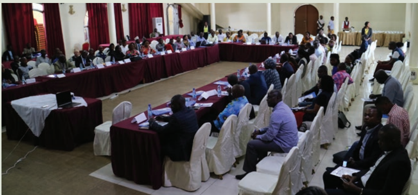
Les participants au Forum sur la paix, la cohésion sociale et les élections

Le Forum sur la paix, la cohésion sociale et les élections s'est tenu du 18 au 20 septembre, à Goma, Nord Kivu. Ces assises ont été organisées par le Cadre provincial de Plaidoyer du Nord-Kivu avec l'appui financier de l'USAID.