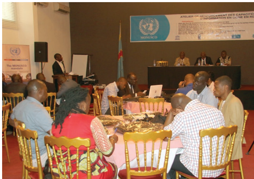
Les participants attentifs lors d'une présentation

Les participants au séminaire sur le renforcement des capacités en matière de collecte, de traitement et de diffusion de l'information en ligne, ont lancé un appel afin que "l'approche sécurité et liberté d'expression" soit davantage prise en compte dans les mécanismes et textes légaux. ■