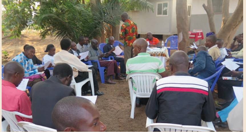
Une vue des participants à la séance de sensibilisation

Dans le cadre de la célébration de la Journée internationale de la Paix, le Bureau de la MONUSCO – Kalemie, notamment, la Section de la Communication stratégique et de l'Information publique et le Bureau Conjoint des Nations Unies aux droits de l'homme ont organisé une séance de sensibilisation à l'intention de cinquante chefs de confessions religieuses de Kalemie. Cette rencontre tenue au quartier général de la MONUSCO, s'est focalisée sur le thème de la célébration : Le droit à la paix – 70 ans après la Déclaration universelle des droits de l'homme. Le Bureau Conjoint des Nations Unies aux droits de l'homme a fait une présentation de la Déclaration universelle des droits de l'homme des points de vue historique, contenu, application et surveillance, avec un accent particulier sur les droits civils et politiques ainsi