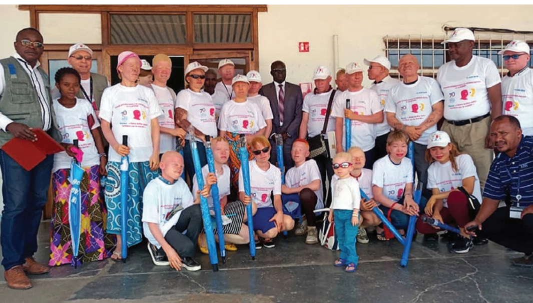
A l'occasion de la Journée Internationale de la Paix célébrée le 21 septembre 2018, le BCNUDH a procédé à la distribution de kits de protection aux partenaires des associations de personnes vivant avec l'albinisme.

✂ Par Tom Tshibangu et Aïssatou Laba Touré/MONUSCO